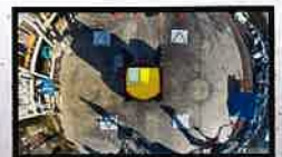
マルチアシストビュー ●